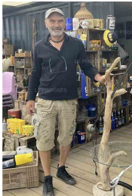
Un jeudi d'été aux Puces du Canal à Villeurbanne. Photo Progrès /Martina MANNINI Aux Puces du canal de Villeurbanne. Photo M. MANNINI Aux Puces du canal de Villeurbanne. Photo M. MANNINI

Samedi 11 septembre de 7 h 30 à 13 heures, sous le chapiteau du canal.