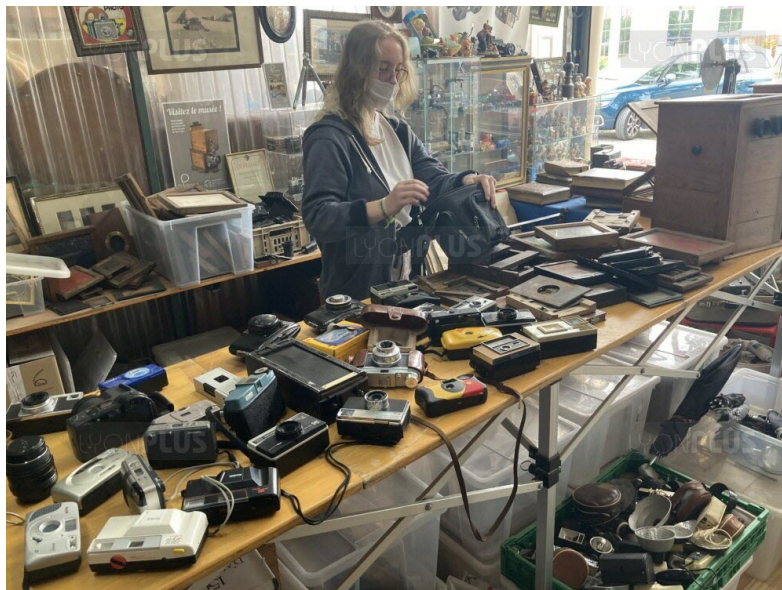
Les amateurs du huitième art peuvent faire un détour au stand 47, dans le quartier des Tôles, où François expose une riche collection d'appareils et accessoires : pour l'argentique mais aussi pour le numérique.