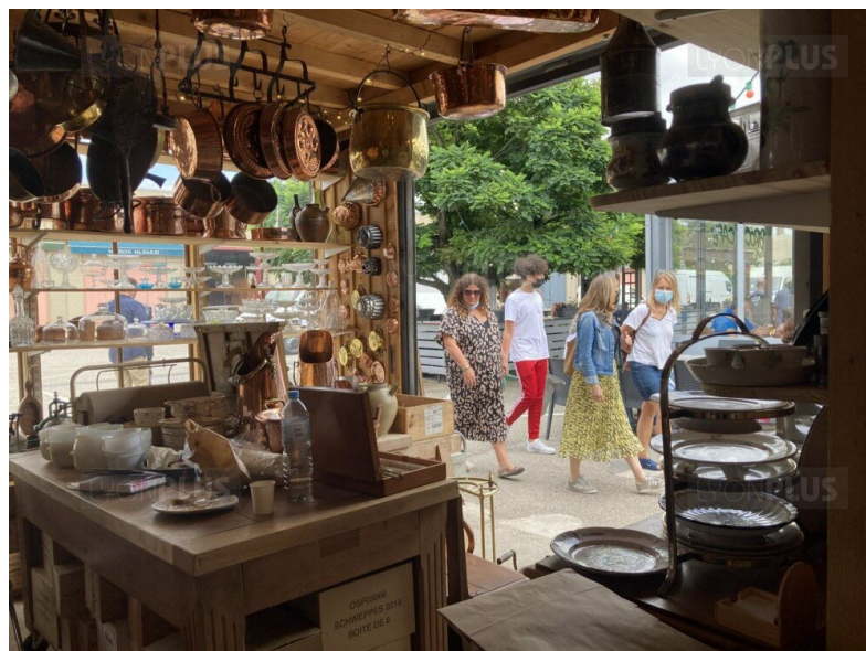
Plus de 10 000 visiteurs déambulent entre le grand hall couvert, les conteneurs aménagés, l'ancienne école et les zones de déballage à la recherche de leur bonheur à petits prix chaque week-end.