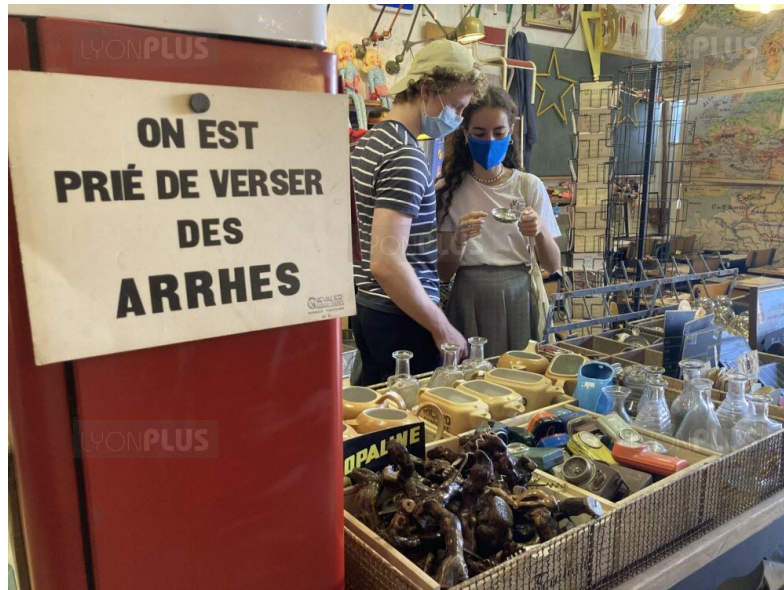
De plus en plus de jeunes viennent flâner aux Pucés pour dénicher des perles rares à prix cassés. Ils sont particulièrement attirés par l'art urbain et les pièces recyclées.