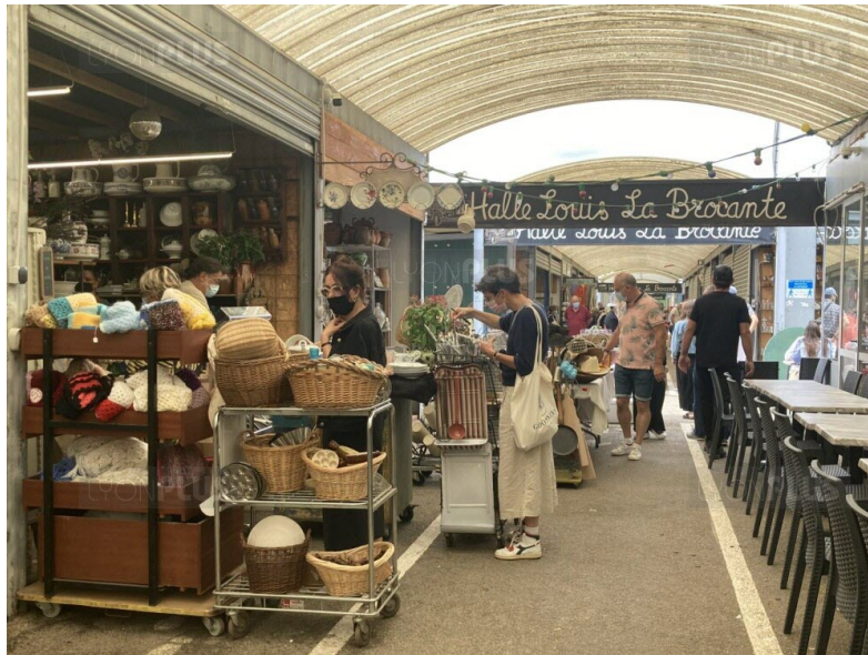
Dans ce village décalé et atypique, chaque objet raconte une histoire et chaque visiteur peut replonger dans ses souvenirs.