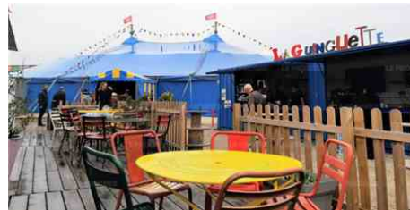
Le chapiteau des Puces.