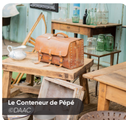
Le Conteneur de Pépé @DAAC