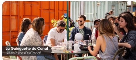
La Guinguette du Canal @LesPucesDuCanal