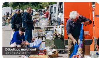
Déballage marchand @EILEAN & JULES