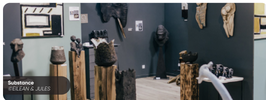
Substance @EILEAN & JULES

ANTIQUITÉS - BROCANTE - VINTAGE - DÉCO - MODE DESIGN - ART - ÉVÉNEMENTS - FOOD - CULTURE