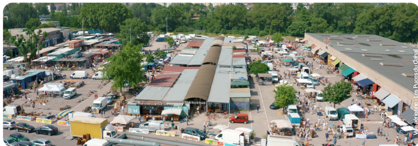
Meziane - Les Puces du Canal

Les Puces du Canal, paradis pour les chineurs