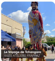
Le Voyage de Tchangara @LES ATELIERS FRAPPAZ