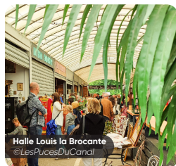
Halle Louis la Brocante @LesPucesDuCanal

ANTIQUITÉS - BROCANTE - VINTAGE - DÉCO DESIGN - ART - ÉVÉNEMENTS - FOOD - CULTURE