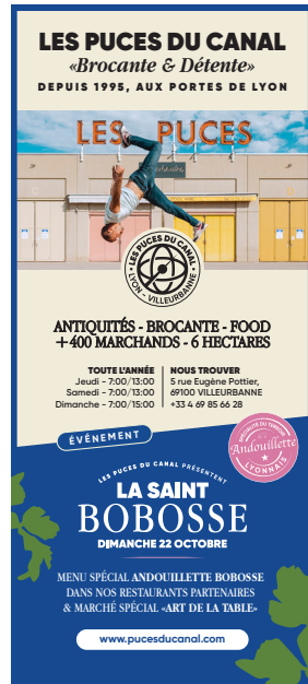
Art & gastronomie Demi Page, automne