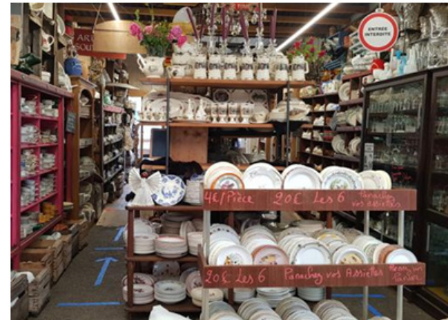
Vaisselle aux Puces du Canal

Si vous recherchez couverts et nappes, verres et assiettes, c'est le moment d'aller chiner aux Puces du Canal. Ce dimanche, elles célèbrent la Saint Bobosse et l'Art de la Table à la lyonnaise. Au menu, ses célèbres andouillettes à dégus-