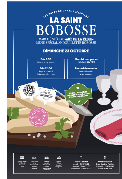
Vue En Ville Affiche A3 x100 disposées dans Lyon centre : restaurants, brasseries, tabac...