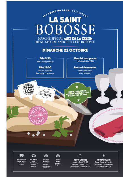
Affiche A3 Sur le lieu des Puces du Canal x20