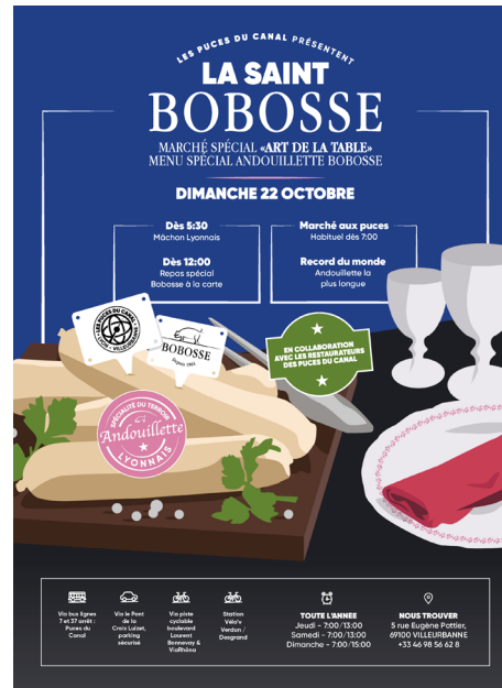
Le Petit Bulletin 1/4 de page