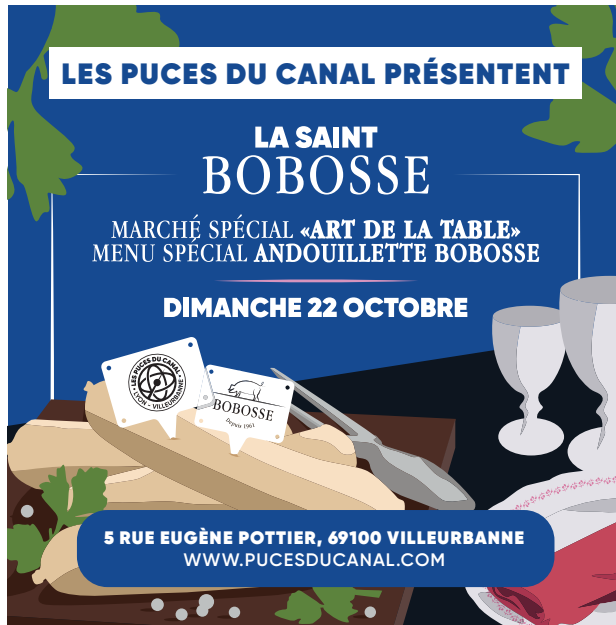
Manchette Le Progrès sur 3 dates au cours du mois