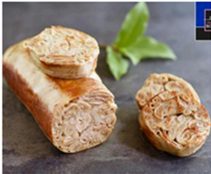
L'andouillette bobosse.

Les Puces du Canal célèbrent la Saint Bobosse et l'Art de la Table à la Lyonnaise avec un événement inédit et la dégustation de ces célèbres andouillettes.